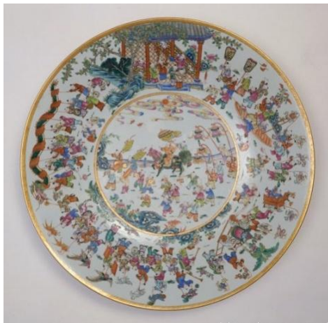
同治大婚百子鬧春大盤

按《景德鎮陶瓷史稿》載，當日復窰用了十三萬兩白銀，但這筆銀子不能算在燒製同治大婚瓷器的直接費用內。實則同治的婚禮費用為1,100兩白銀，另燒製大婚瓷，則用了一萬八千兩，前後耗時三年燒成，成品共計120桶、7,290件。如果按照同治十年的糧食價格估算，當時一兩白銀的購買力，大約等如港幣350元。當時花了一萬八千多兩，折合港幣630多萬，做了7,290件瓷器，平均一件才花了不到港幣900元。因為所燒製都以食器為主，這個造價還算合理。