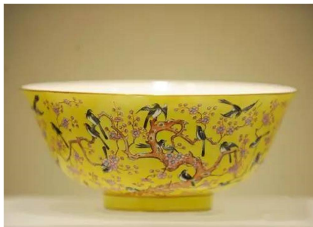
同治大婚梅花喜鵲碗

大婚用瓷以紅、黃二色為主，紅者主吉慶，黃者乃帝王之專用色。器皿以食具為主，配色則以彩藍、翠綠、藕粉、鮮紅、象牙、姹紫等色彩繪，並描金寫喜字。瓷器上的紋飾，恪守傳統，圖必有意，意必吉祥。大婚瓷器將瓷器裝飾藝術發揮得淋漓盡致，例如以蝙蝠代表「鴻福」，以代表「夫妻百年」的蝴蝶、鴛鴦、龍鳳入瓷；又以代表「多子」和「百年好合」的百合、代表「喜上眉梢」的喜鵲和梅花；代表大婚吉慶的「喜」和「囍」作飾。我眼見過的同治大婚用瓷紋飾有「黃地雙喜蝴蝶紋」、「黃地梅鵲紋」、「紅地描金雙喜紋」、「紅地雙喜龍鳳紋」、「黃地紅蝠紋」、「喜上梅梢紋」、「黃地喜字紋」、「黃地百蝶紋」等。真個繽紛爭妍，目不暇給。