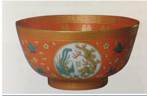
同治大婚紅地雙喜龍鳳紋碗