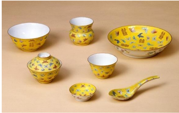
黃地雙喜蝴蝶食具

按《景德鎮陶瓷史稿》載，當日復窰用了十三萬兩白銀，但這筆銀子不能算在燒製同治大婚瓷器的直接費用內。實則同治的婚禮費用為1,100兩白銀，另燒製大婚瓷，則用了一萬八千兩，前後耗時三年燒成，成品共計120桶、7,290件。如果按照同治十年的糧食價格估算，當時一兩白銀的購買力，大約等如港幣350元。當時花了一萬八千多兩，折合港幣630多萬，做了7,290件瓷器，平均一件才花了不到港幣900元。因為所燒製都以食器為主，這個造價還算合理。