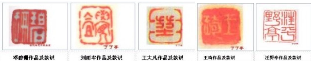
珠山八友部份用印

20 世紀 50 年代末期，劉雨岑給輕工部陶瓷研究所附屬工廠設計的「水點桃花」餐具，成為釣魚臺國賓館接待外國元首的用瓷。1969 年劉雨岑辭世後，其子劉平於 1975 年亦以釉上「水點桃花」技法設計了著名的「7501」瓷，這套「最後的官窯」，蜚聲國際，被海內外收藏家爭相收藏，也算是「珠山八友」的遺澤了。