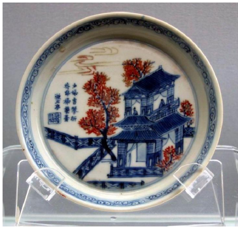
上海博物館藏康熙辛亥中和堂製青花釉裡紅盤

我參看上博的藏品「中和堂青花釉裡紅盤」，此盤已經上博鑒定為「官窯」。但奇怪的是，此盤除了有「中和堂」底款外，盤面尚有題詩及「漱玉亭」的款識，上博沒有解釋原因；但眾所周知官窯器基本上不可能有私人名號或齋號，這疑點對證明「中和堂」瓷器是官器的認知便大有衝突了。換句話說，「中和堂」極有可能是民窯器。