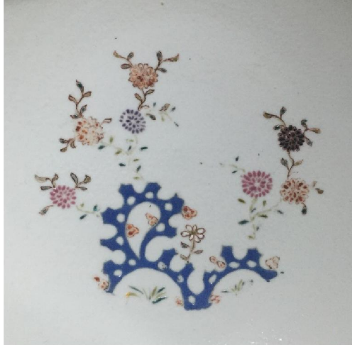
康熙粉彩流行之菊花洞石紋

「中和堂」瓷品除青花外，尚有青花釉裡紅、五彩、粉彩。其中康熙時期粉彩因為是初創，所以繪畫簡單，圖案以花卉為主，例如「菊花洞石」就是其中之表表者。康熙粉彩不比雍正時期之成熟，雍正無論題材、器型、釉色、技法都達到幾乎完美的階段。康熙早期粉彩紋飾相對簡單，極為素雅，而且粉彩經常發現有脫釉現象，這表面看來像瑕疵的缺陷，實則是康熙粉彩的特色。傳世的「中和堂」粉彩瓷，恰恰亦有此特徵。