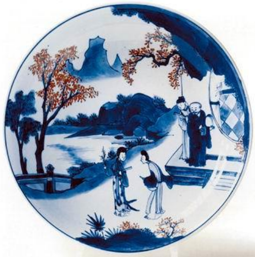
英國巴特勒家族藏康熙癸丑中和堂製青花釉裡紅盤

今日所見康熙「中和堂」款，只有「康熙辛亥中和堂製」、「康熙壬子中和堂製」、「康熙癸丑中和堂製」三種，從干支推算，則分別為康熙十年(1671)、康熙十一年(1672)及康熙十二年(1673)。