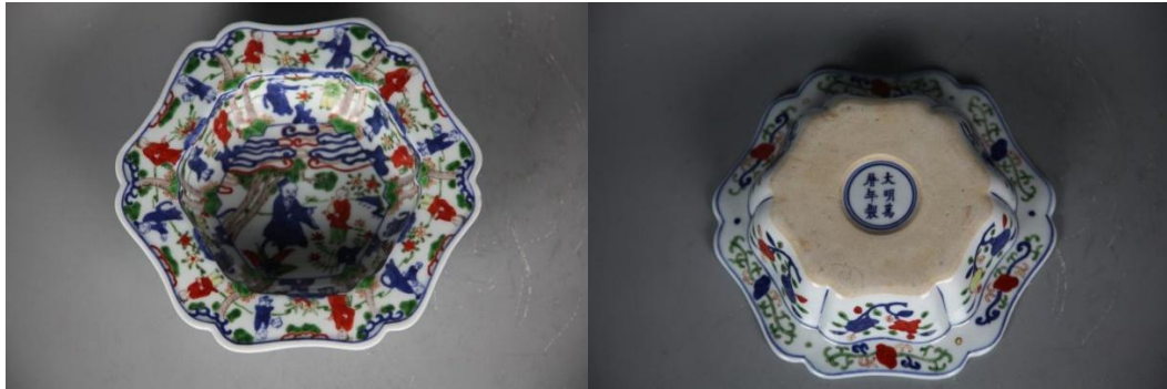
康熙仿萬曆青花五彩折沿盆及底款

其次常見的是「康熙仿萬曆」年款了，萬曆寄託款，只見「大明萬曆年製」青花楷書六字款。附圖之「康熙仿萬曆青花五彩人物折沿盆」可作為一個較有代表性的參考。