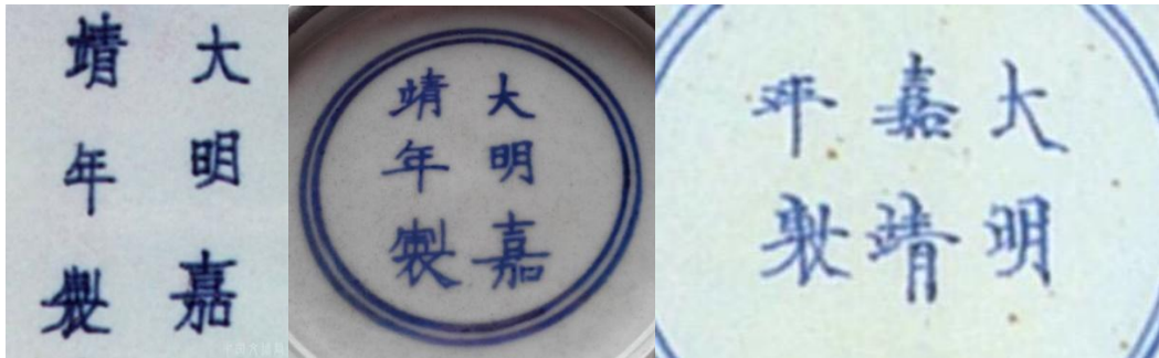
「大明嘉靖年製」寄託款

從前談「中和堂款瓷器」時，談過康熙早期的瓷器，有兩大特色，一為「官搭民燒」，二是「不尚尊號」，所以常見有無款的康熙瓷器，因康熙早年一度禁止民窯在瓷器上署本朝年號，所以康熙時期景德鎮官、民窯瓷器，都盛行仿寫前朝年款。