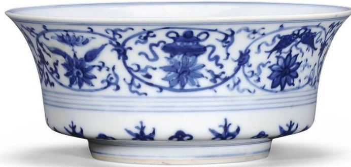
康熙仿宣德青花花卉紋碗