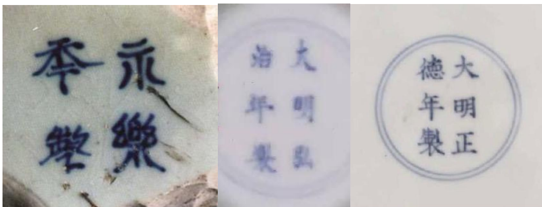
康熙仿寫永樂、弘治、正德寄託款

康熙仿寫成化年款亦多見，均在外底青花楷書寫「大明成化年製」雙行款，外圍亦用青花雙方框。常見者有仿成化青花纏枝花紋碗、嬰戲紋碗，葡萄紋杯等外，亦有見有仿成化鬥彩雞缸杯者，例如英國劍橋費斯威廉 (Fitzwilliam) 博物館藏的雞缸杯，非常精美，但也是康熙仿製寫成化款的。康熙仿成化款的瓷器，亦常見有青花蓋罐、龍鳳紋大盤、花瓶等康熙時期流行之大器，有別於成化一朝的鬥彩薄胎器，瓷友都一望而知。