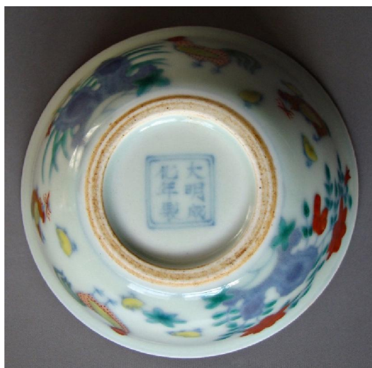
康熙仿「大明成化年製」鬥彩雞缸杯

至於仿寫永樂年款瓷器，相對小見，有見過青花龍紋碗和青花纏枝蓮紋壓手杯寫「永樂年制」四字雙行變體篆書款的。康熙亦有仿寫正德年款的瓷器，多為藍料楷書「大明正德年製」雙行款，或楷書「正德年制」雙行款，字體工整。而康熙仿寫弘治年款的瓷器，多為雙圈青花楷書六字雙行款，仿款字體較長，有的甚至還把「治」字錯寫成「冶」字。讓人啼笑皆非。