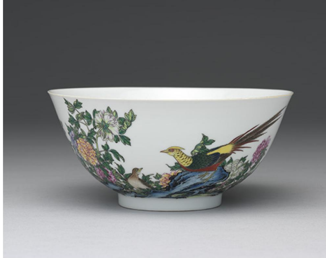
台北故宮藏錦堂春富貴白地宮碗

至於在北京故宮博物院藏的雍正琺瑯彩瓷，則有「白梅花紅地鍾」一對（有傷），「眉壽白地宮碗」又名「梅花牡丹碗」一件（有傷），「眉壽長春白地宮碗」一件（有傷），「紅白梅花黃地茶碗」一件（完好），「錦堂春富貴白地宮碗」一件（完好），共六件。