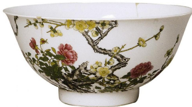
北京故宮藏眉壽白地宮碗(梅花牡丹碗)

至於在北京故宮博物院藏的雍正琺瑯彩瓷，則有「白梅花紅地鍾」一對（有傷），「眉壽白地宮碗」又名「梅花牡丹碗」一件（有傷），「眉壽長春白地宮碗」一件（有傷），「紅白梅花黃地茶碗」一件（完好），「錦堂春富貴白地宮碗」一件（完好），共六件。