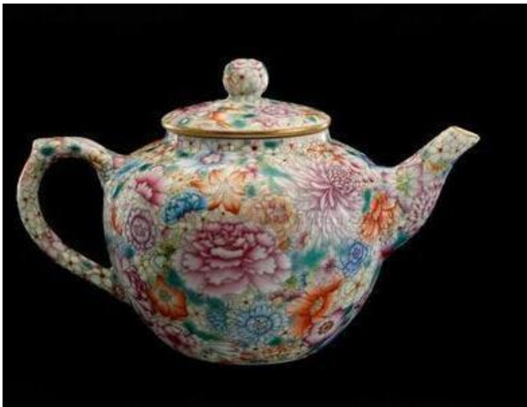
南京市博物館藏蔣介石用瓷之一

蔣介石當日在大陸南京黃埔路總統官邸的日常用瓷器，全部在景德鎮訂制，這批瓷器都用蔣介石在奉化溪口祖居「豐鎬房」款或「蔣」字款。紋飾幾乎全為粉彩「百花不露底」。當日的官邸日常餐具，撤退時沒帶去台灣，全被南京市文物保管委員會接管，70年代撥歸南京市博物館保存。這套餐具，是民國時期著名的瓷器設計師彭友賢1946年的作品。彭友賢是江西人，早年就讀杭州國立藝術院，後留學法國，1945年，他在景德鎮創辦了中國瓷廠，後來因貨幣貶值，資金枯竭，於1948年初倒閉了。