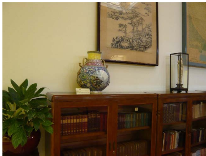
台北中正紀念堂陳列國禮瓷

這件瓷器，參看估價單，當年造價 550 萬。民國 36 年仍流通法幣，唯國民政府任意發行，造成惡性通貨膨脹；1948 年 5 月才被金圓券取代。1947 年外匯黑市基本徘徊在 2000 法幣兌一美元上下；迄 8 月 19 日，中央銀行宣佈將法幣與美元的比價下調到 1 美元兌換 3350 法幣。所以報價時，此瓶造價為 2,500 美元，但收款時卻貶為 1,642 元了。但 1947 年 2,500 美元的購買力，大約相等現在的港幣 100,000 元。可知這批國禮，真的是異常名貴，件件精雕細琢。