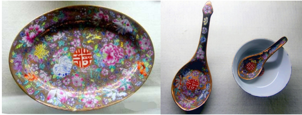
南京市博物館藏蔣介石用瓷之二

1945年8月15日，日本昭和天皇發表了《終戰詔書》；並於日本時間1945年9月2日上午，在停泊於東京灣的美國軍艦密蘇里號遞了降書。此後9月3日是我國的「抗日戰爭勝利紀念日」，兩岸多年沿用，後來台灣改該日為「軍人節」。抗戰勝利，普天同慶，中國戰時為同盟國成員，蔣介石當時又是中國戰區司令，所以為着紀念抗戰勝利，向景德鎮訂製一批瓷器，贈送給友邦元首，表示慶賀。這件事由當時蔣介石的專任侍衛長及參軍處軍務局長俞濟時負責，向江西省立陶瓷科職業學校校長汪璠洽談。按汪璠民國36年（即1947）十二月手書的工料單，得知當時是訂做四種瓶樣及兩種餐具樣辦，訂製時為1947年八月；落款用「中華民國三十六年」，下有「中正」二字方框款。