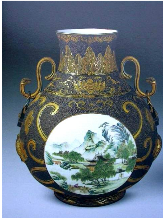
彫刻沙地開光花瓶

這件瓷器，參看估價單，當年造價 550 萬。民國 36 年仍流通法幣，唯國民政府任意發行，造成惡性通貨膨脹；1948 年 5 月才被金圓券取代。1947 年外匯黑市基本徘徊在 2000 法幣兌一美元上下；迄 8 月 19 日，中央銀行宣佈將法幣與美元的比價下調到 1 美元兌換 3350 法幣。所以報價時，此瓶造價為 2,500 美元，但收款時卻貶為 1,642 元了。但 1947 年 2,500 美元的購買力，大約相等現在的港幣 100,000 元。可知這批國禮，真的是異常名貴，件件精雕細琢。