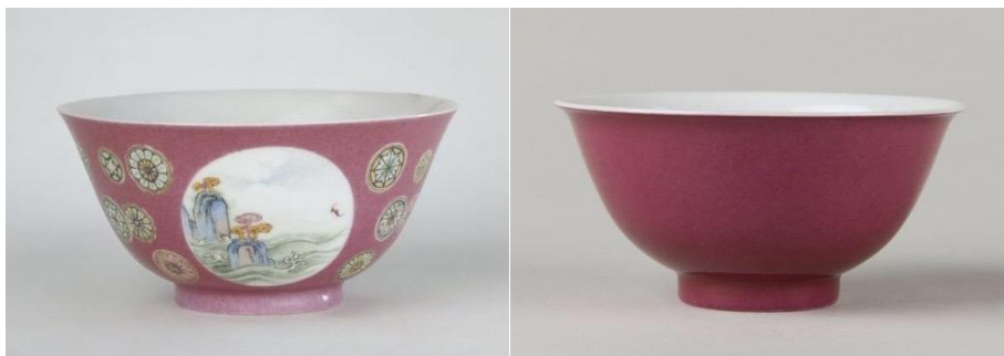
北京故宮藏雍正紅地吹釉碗二款

有關「吹釉」的方法，《陶冶圖說》也有描述，並且解釋了為什麼要使用「吹釉」法及施工要領。書云：「圓琢各器，凡青花與官、哥、汝等均須上釉入窯。上釉之法，古制，將琢器之方長稜角者，用毛筆搨釉，弊每失於不勻。至大小圓器及渾圓之琢器，俱在缸內蘸釉，其弊又失於體重多破；故全器倍為難得。今惟圓器之小者，仍於缸內蘸釉；其琢器與圓器大件，俱用吹釉法。以徑寸竹筒，截長七寸，頭蒙細紗，蘸釉以吹，俱視坯之大小，與釉之等類，別其吹之遍數，有自三、四遍至十七、八遍者，此吹蘸所由分也」。