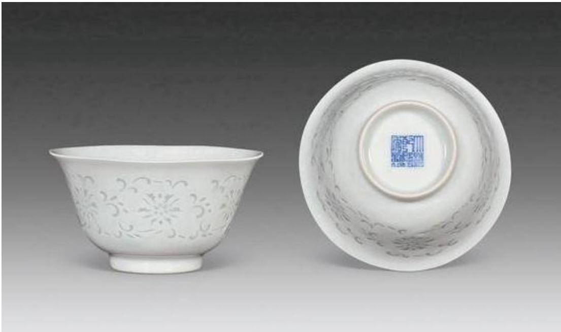
乾隆仿影青釉玲瓏瓷花卉紋碗