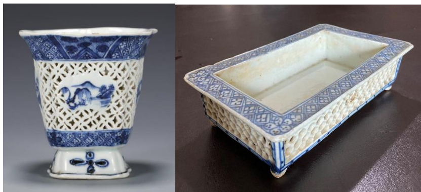
清代民窯青花鏤空瓷二款

我在《續篇》中提及殷弘緒信中介紹了「polished metal mirrors」色釉 (法文本原信作 mirois ardens，即火鏡之意)，應該就是我們的「金紅釉」，也介紹了吹紅 (原文作 Soufflé red) 和灑紅釉。這些外語陶瓷專用名詞，三百多年後的今日，歐洲陶瓷界仍沿用，其影響不可謂不深。