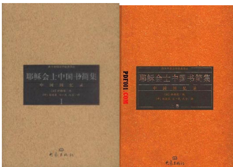
大象出版社耶穌會士中國書簡集 - 中國回憶錄》2001 年紙版(左) 及 2005 年電子版(右)

我估計英文本的譯者沒讀過我的中文文章，所以應該還沒有更正；但我發現近期網上談殷弘緒的也有引用我的文章觀點。但話又說回來，在所有中譯本中，翻譯得比較接近的，是大象出版社 2001 年出版的《耶穌會士中國書簡集 - 中國回憶錄》，其中殷弘緒於 1712 年發自饒州，談當地教堂及教徒狀況，與及談景德鎮瓷器生產製作的兩封信，都譯作《耶穌會傳教士殷弘緒神父致中國和印度傳教區巡閱使神父的信》。其中奧里神父的身份是「巡閱使」，這已經把意思和神髓帶到了，但「The Indies」譯作印度，希望再版時更正之。