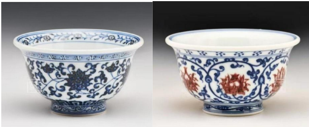
現代名家仿壓手杯

現代新仿的永樂青花壓手杯，大都出自名家之手，像真度頗高，唯當日所用的麻倉土已枯竭，雖然仿品成器的外表、規格、細節非常接近，亦無法重現當日的瓷質形態和重量。北京故宮館藏的永樂「獅球心」重158克，「花心」重160克。若瓷友碰巧亦有玩物與真品規格一致者，故且印證可也。但國內名家作品，多以藝術品形式出售，雖索價動輒以萬元計，但卻有瓷家名號，亦有說明是仿永樂壓手杯，並無欺詐之嫌；而至於刻意以假作真售與存心檢漏者，則屬兩相情願，與人無尤。