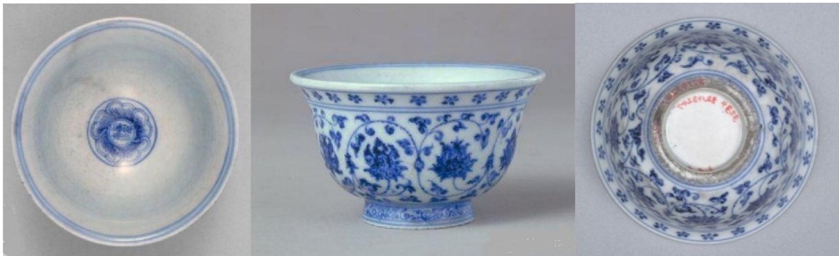
北京故宮藏明永樂青花(花心)壓手杯之一

前幾天有盜友私訊我，以興奮的語調云，磨劍十年，跑遍全國，結果皇天不負苦心人，覓得一件「明代永樂青花壓手杯」，並邀我一同欣賞。我心中當然感激，但我隨即告訴他；「永樂壓手杯」是另外一個不必用眼看，只需用耳聽，就可辨識是仿品的名瓷。