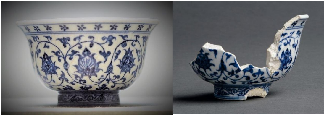
蘇州博物館藏永樂青花壓手杯 (左) 及景德鎮御窯博物院藏永樂青花壓手杯殘器 (右)

現代新仿的永樂青花壓手杯，大都出自名家之手，像真度頗高，唯當日所用的麻倉土已枯竭，雖然仿品成器的外表、規格、細節非常接近，亦無法重現當日的瓷質形態和重量。北京故宮館藏的永樂「獅球心」重158克，「花心」重160克。若瓷友碰巧亦有玩物與真品規格一致者，故且印證可也。但國內名家作品，多以藝術品形式出售，雖索價動輒以萬元計，但卻有瓷家名號，亦有說明是仿永樂壓手杯，並無欺詐之嫌；而至於刻意以假作真售與存心檢漏者，則屬兩相情願，與人無尤。