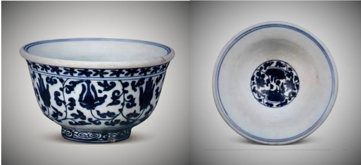
北京故宮藏明萬曆仿永樂青花(鴛鴦心)壓手杯