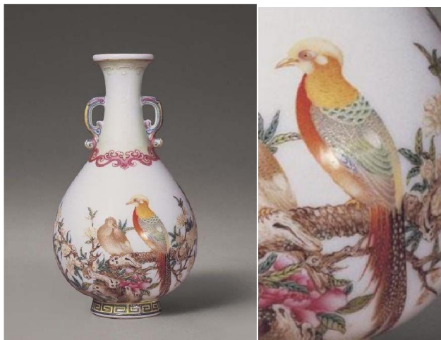
乾隆琺瑯彩花石錦雞圖雙耳瓶

上文談到流傳有序，追溯到古董商便戛然而止，似乎買家、藏友都滿意這「序」了，尤其在「序」之後，又有國際拍行的拍賣文件加持，對投資或投機的藏友已是一個認可的定心丸了。就我記憶所及，再列舉幾個以古董商做流傳序終結的拍賣個案，反正瓷器業已以天價成交，信服與否，不在此文討論範圍。