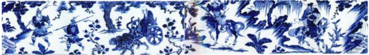
元青花鬼谷子下山圖全景

此「元青花鬼谷子下山圖罐」高27.5cm，於2005年7月12日倫敦佳士得之「中國陶瓷工藝精品及外銷工藝品」拍賣會上，以1,400萬英鎊拍出，加佣金後為1568.8萬英鎊。折合人民幣價值2.3億元，該罐由英國倫敦古董商埃斯肯納茲 (Eskenazi) 拍得。雖然事後很多中國專家對此罐的來歷及真正價值有爭議，但不影響這個拍賣結果。