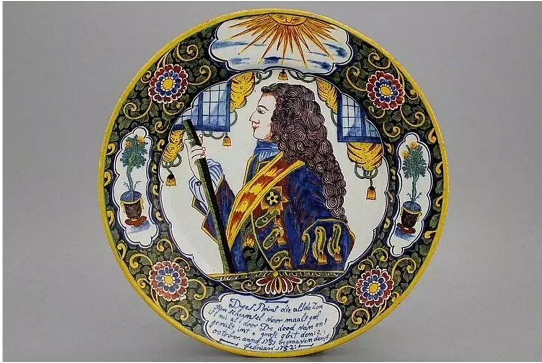
另類紋章瓷 - 路易十四 (Louis XIV 1638 - 1715) 服飾圖案