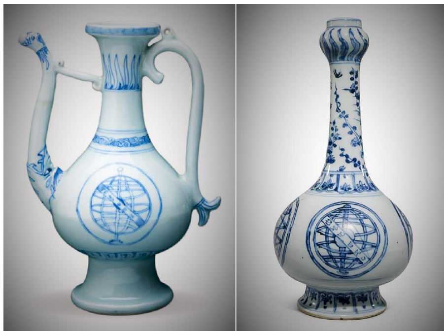
正德年間葡萄牙國王馬努埃爾一世訂燒繪有渾天儀的執壺 (左) 及蒜頭瓶 (右)

後來達伽馬帶返葡萄牙的貨物，有以黑胡椒和桂皮為主的香料，與及少量瓷器樣本等，都是在印度就地採購的，反正印度本來就是香料中心，亦是中國瓷器集散地。印度商人一向也把瓷器轉運至中東、歐洲一帶的。其實當時哥倫布 (Cristoforo Colombo 1451-1506) 在 1492 年代西班牙出航之目的地，也是包括東南亞各國和印度次大陸在內的「東印度」，其目的物也應該同樣是香料、瓷器。不料陰差陽錯到達了一個他以為是印度的新大陸，還將這個大陸上的原住民叫做「Indios」，即西班牙語印度人之意。由是觀之，印度之旅，葡萄牙是「遲來先上岸」了。