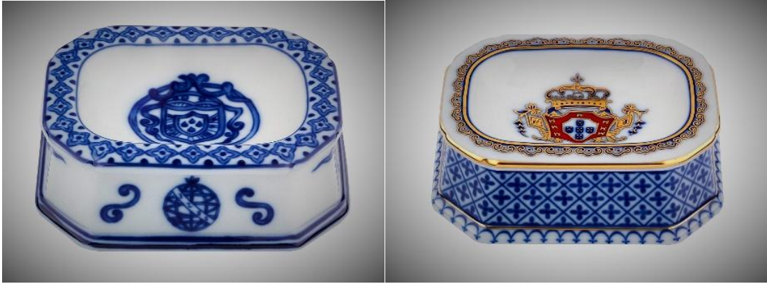
明代葡萄牙皇室訂製的鹽皿

1520 年是正德年，雖然明代海禁期間，亦有鄭和下西洋的壯舉，但只是官方的貿易外交，民間仍然片板不得下海，直至隆慶 (1567-1572) 年間，政府才允許民間通海經商。隆慶元年開關之後，明朝政府「議開禁例」，全國只開放月港「販東西二洋」對外通商，月港的繁榮帶來漳州窯業的興盛。