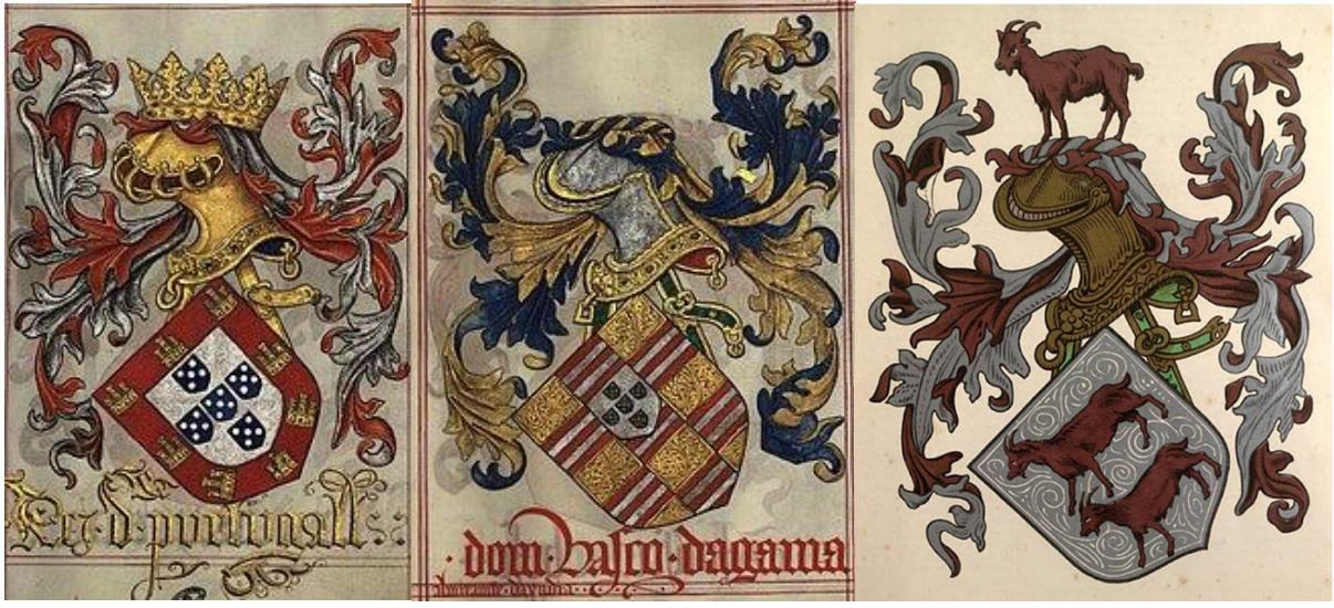
馬努埃爾一世(左) 達伽馬 (中) 卡布拉爾 (右) 紋章

達伽馬在1498年只到達了印度的科澤科德 (Calicut)，鄭和在1433年時也在此城去世的。達伽馬當時並未有進入中國，而當時澳門亦非葡屬。葡萄牙人正式在澳門定居的時間大約是在1553年左右，因為船抵澳門時遇風暴，以貨物被水浸濕，要求借地晾曬貨物為由登了岸。後來為了配合耶穌會在中國及其他東亞國家的傳教活動，所以葡萄牙人於萬曆年間以每年白銀五百兩向中國租借了澳門作為遠東的中心，其實嘉靖四十三年 (1564) 時，葡萄牙傳教士來華，都是先到澳門，才轉入中國的；此乃後話。