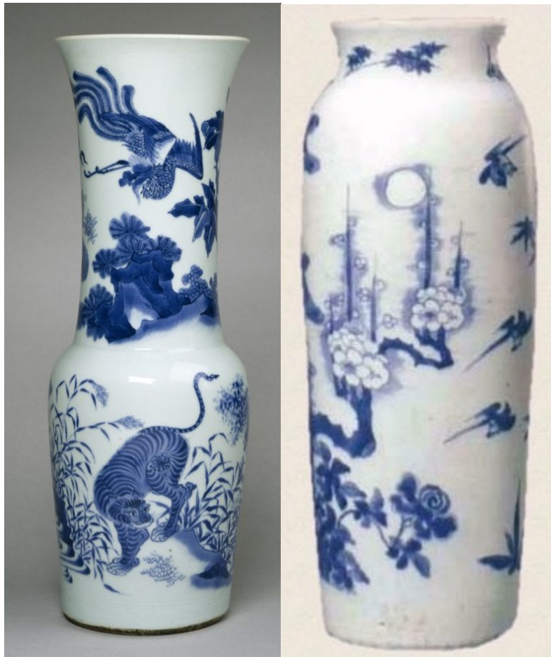
典型過渡期青花瓷瓶