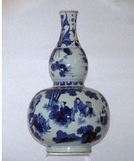
過渡期葫青花葫蘆瓶