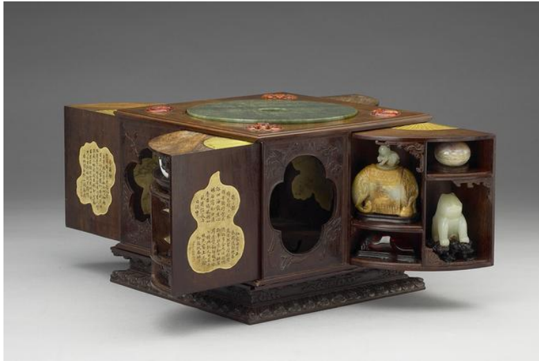
台北故宮藏乾隆百什件木匣