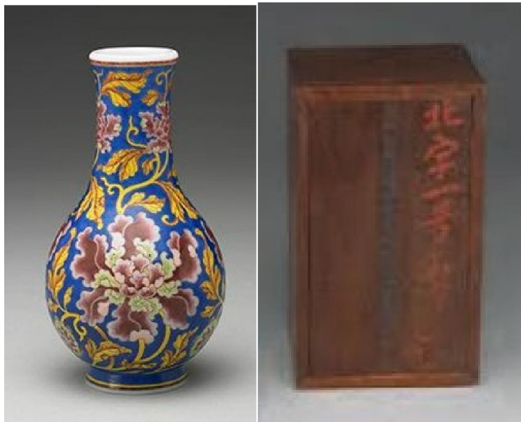
台北故宮藏康熙玻璃胎畫瑤瑯牡丹藍地膽瓶及相配楠木匣

乾隆三年的《活計檔》有「入乾清宮配匣瓷器」條。配匣當時算是創舉，沒有先例，當時乾隆批示：「此磁器內選出成對者，下剩不成對之零件，嗣配裝完成時，另行呈覽。再將重華宮、養心殿所有磁器，亦交出選看，按等次歸入在配匣磁器內，其配成之匣蓋上，俱按名色刻簽子，應填何色填何色，欽此」。