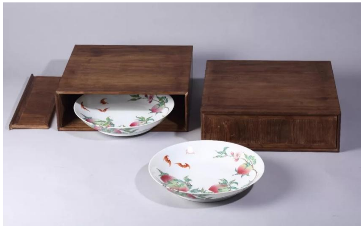
八桃盤配楠木匣示範

從這段文字可知，當時集中處理重華宮、養心殿二宮的瓷器。標籤是以在匣蓋和匣頭雙重題名互相比對的方式來顯示等級。此外之前已規定木匣刻字，頭等用青、黃、綠色；二等和三等，則只在匣橫頭一處標識出品名即可。