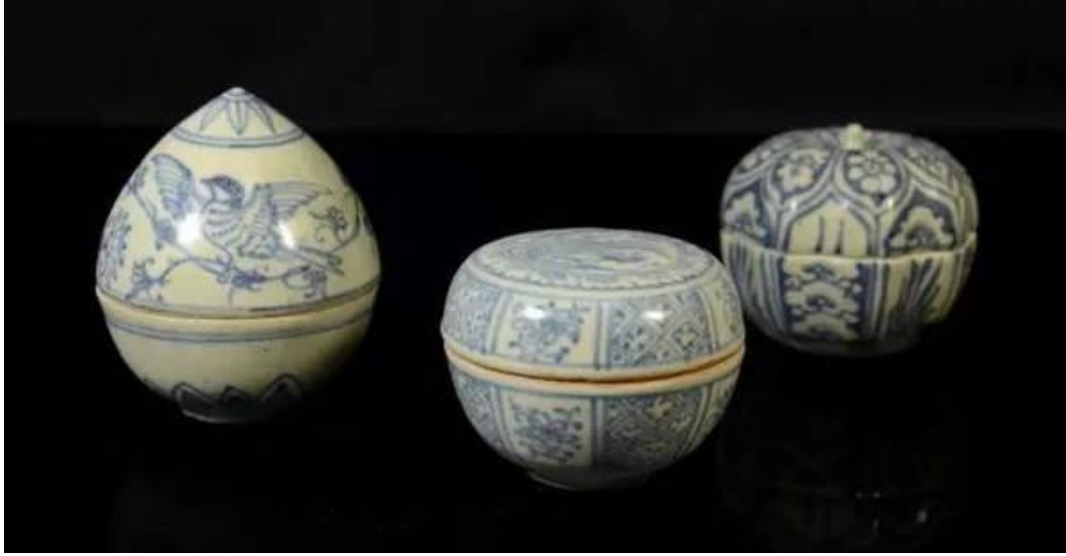
台北故宮藏出水越南海陽青花瓷盒