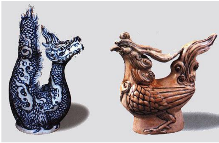
菲律賓及澳洲私人收藏越南龍首壺和鳳首壺