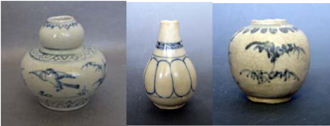
會安沉船的出水瓷

但對越南瓷業最重要和最有影響的，為在1996年耗時四年挖掘的越南廣南省 (Tỉnh Quảng Nam) 出水的「會安沉船殘骸」 (Hội An Wreck)，是十五世紀末在會安港海域沉沒的泰國船；載有15世紀晚期越南紅河下游海陽省 (Tỉnh Hải Dương) 朱豆窯 (Chu Đậu) 和升龍窯等窯口所產的家用、文房瓷器，有青花瓷、紅綠彩、彩繪描金、鏤雕瓷和白瓷，及船員所用的景德鎮民窯瓷具，共25萬件。越南青花瓷是因為明朝海禁而於十五世紀初發展而蓬勃起來的外銷物種，十五世紀中葉至十六世紀大量自越南外銷至東南亞、東亞、中東、東非一帶。越南青花，早期受景德鎮青花影響，但後期風格卻受雲南玉溪窯的影響。有關玉溪窯，我從前在拙文《玉溪窯元青花》有畧述，此處不贅了。