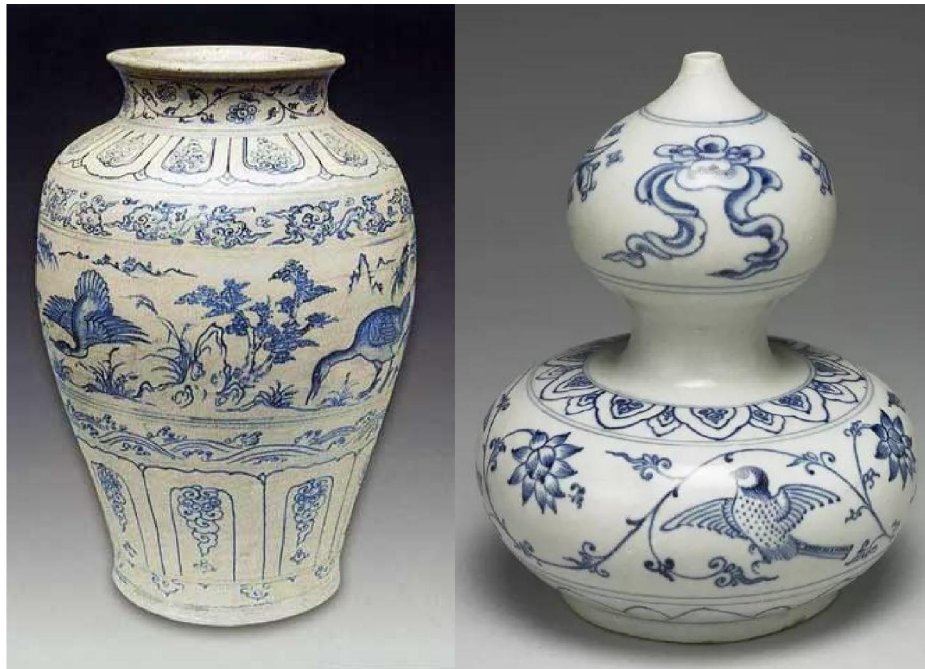
台北故宮藏越南海陽瓷器

越南最著名的沉船殘骸就是「頭頓沉船」(Vũng Tàu Wreck)，於距越南頭頓市約100公里發現的一艘裝了中式三桅帆的歐式貨船殘骸。該船由中國航行到椰加達，船上滿載包括荷蘭東印度公司訂購的瓷器共48,288項文物；可惜不是運載越南瓷器，而是大量清代景德鎮燒製的青花瓷，後於1992年由英國佳士得連同 28000片瓷片在阿姆斯特丹拍賣，其餘瓷器交由越南政府處理。