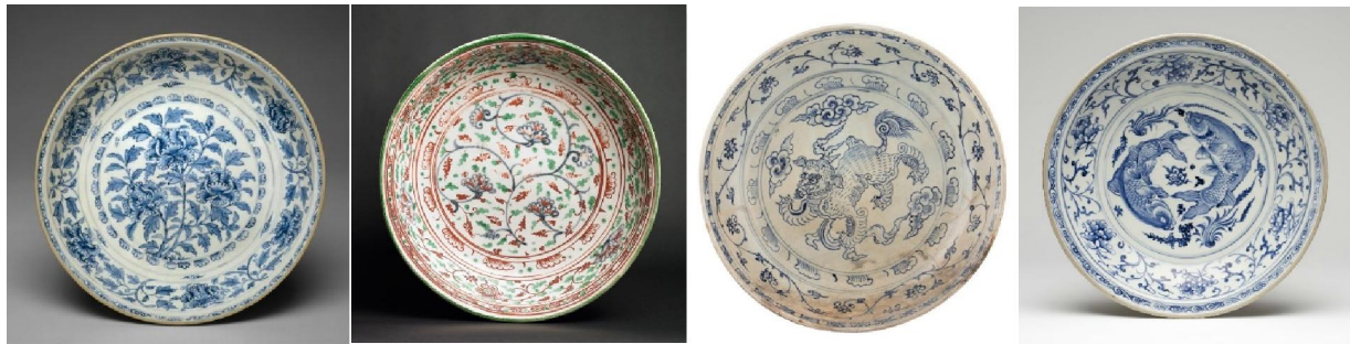
越南李朝鉢場瓷器 (左1及左2) 及海陽瓷器 (右1及右2)

安南古稱「交趾」，公元679年唐代設「安南都護府」於現在的河內地界，安南十世紀始正式建國，迄南宋孝宗淳熙元年 (1174)，賜國名為「安南」，封南平王李天祚為「安南國王」，國人遂稱越南為「安南」。安南15世紀時又被明朝直接統治了20多年；清以後歸順為我國藩屬，迄嘉慶七年 (1802)，阮福映建立了阮朝，表請清廷冊封為「南越國王」，始有「越南」之名。明代三寶太監鄭和七次下西洋，安南 (An Nam) 和占城 (Chiem Thanh) 幾乎是每一次必經之補給站。