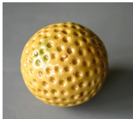
瓷質黃釉凹洞捶丸

「捶丸」打擊用的球就叫做「丸」，現在留存世上最多關於捶丸的物件就是「丸」，上好的「丸」，用瘿木製成，瘿木就是樹瘤，也有用翡翠，瑪瑙，石頭、骨角做成；但論外表漂亮，耐擊而又便宜，則以瓷球最受歡迎。