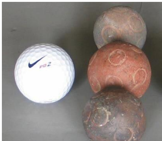
捶丸與高爾夫球的比較

正就是因為「丸」外形的單一性，不花巧，不佔地，容易保存，又不易摔破，但每顆釉面彩色豐富，變化萬千，觀賞性甚高，又有歷史價值，今日市場所見，精品仍甚多，而且價格偏廉，數十至數百即可得，頗多瓷友好之。