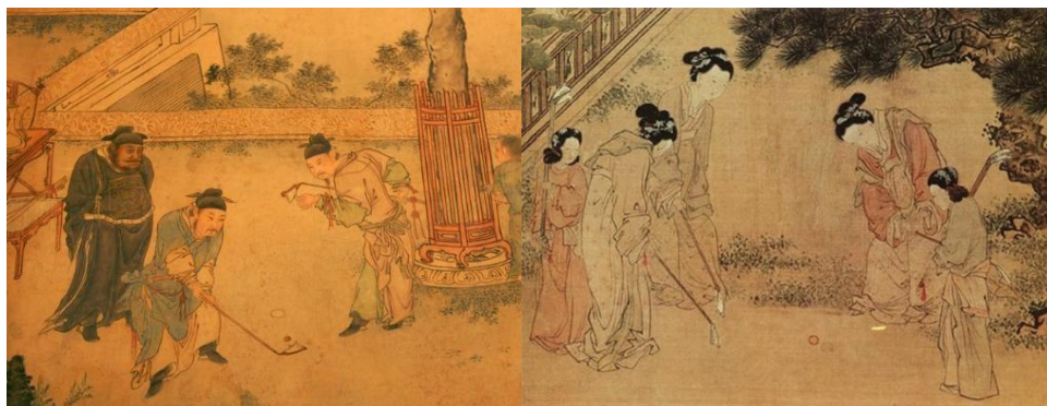
《明宣宗行樂圖》(左) 和《捶丸仕女圖》(右)

「捶丸」最早見諸文字，為至元十九年 (1282) 寧志齋的《丸經》，該書記載了捶丸的發展歷史，闡述了捶丸的場地、器具、競賽規則，以及各種不同的擊法和戰術，還特別強調了體育精神和道德，與現代高爾夫運動有著驚人的相似。