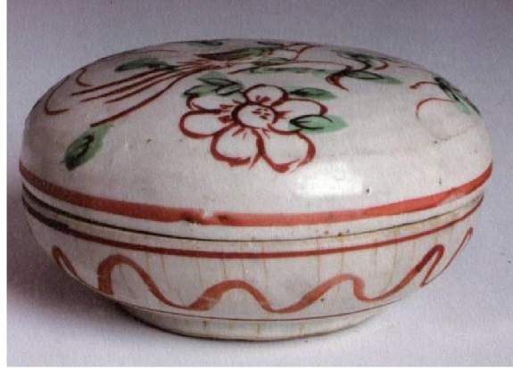
明漳州窯五彩花鳥紋盒

1997 年秋發掘的田坑窯址，面積 300 餘平方米，出土瓷器有素三彩、青花瓷和少量青瓷、白瓷、醬釉瓷。素三彩器是二次燒成，釉色有綠、黃、紫、褐等。出土瓷除盤、碟、碗、罐、鉢、瓶、杯、盞、硯等外。更多的是器形各異，尺寸不一，紋飾多樣，製作精巧的種種式式的蓋盒。皆有繪畫、浮雕、模印等裝飾；紋飾有錦地紋、萬字紋、寶相花紋、花卉、走獸、果品、水產等；亦有以墨書姓氏、干支、數字、方位、吉祥語等各種文字的蓋盒。