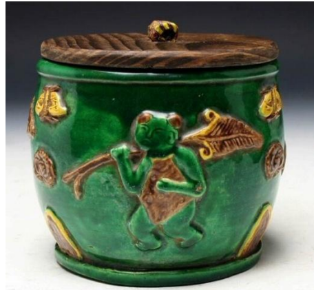
漳州窯素三彩蓋罐