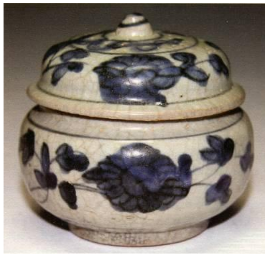
漳州窯青花花卉紋蓋罐

迄萬曆三十年(1602 年)，景德鎮窯工群起反抗負責督燒大龍缸的太監潘相欺壓而造反，火燒御窯。後窯工畏罪四散逃迭，加上江西景德鎮因高嶺土資源枯竭，製瓷業一片蕭條，幾致停產。荷蘭東印度公司四處尋找供貨方。此時由江西向南逃至鄰省福建的部分窯工，也加入到漳州窯的燒造。原來在景德鎮訂貨的貿易商，逐漸把訂單轉向交通方便，有沿海港口貿易優勢的漳州，由此掀開了漳州窯大規模的海外貿易發展時期。史載當時荷蘭東印度公司（荷蘭語：Vereenigde Oostindische Compagnie，簡稱 VOC）曾於 1621 至 1632 年間，三次在漳州收購瓷器，數量動輒上萬，這些漳州窯瓷器，就是名聞中外的「克拉克瓷」了。