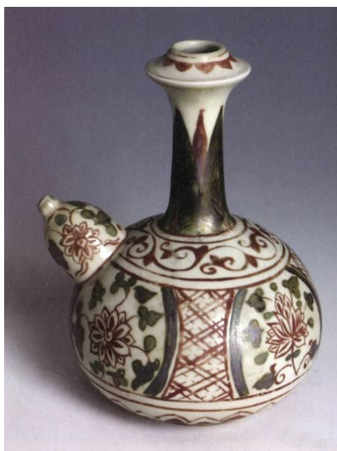
漳州窯五彩花卉紋軍持

目前，除國內各地文博單位收藏外，漳州窯瓷器在歐洲、日本及東南亞國家各大博物館及私人都有收藏；尤其是日本，「交趾瓷」(Koji Sho)，「吳須付染」(Shimitsu 即青花)、「吳須赤繪」(Akac 即五彩)等有關漳州器的學術名詞，便是源於日文。