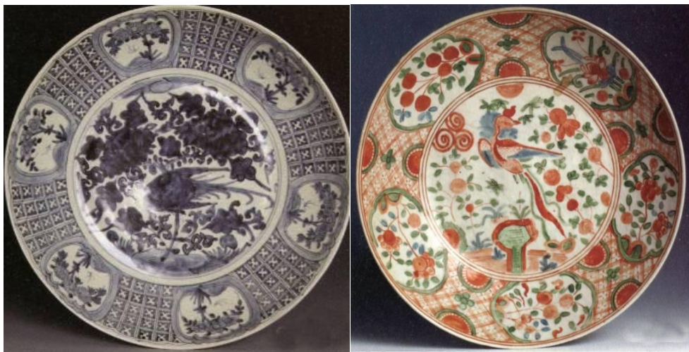
漳州窯青花鳳凰紋大盤(左) 漳州窯五彩鳳凰紋大盤(右)

前些時談過福建同安窯系珠光青瓷，不由聯想起漳州窯。國外學者把明代粗瓷器統稱為「汕頭瓷」(Swatowware)，以為這些陶瓷是從汕頭出口的，但現代學者已改稱之為「漳州器」(Zhangzhouware)了。其實國際間聞名的「克拉克瓷」(本為荷蘭語Kraakporselein，英語文作Kraak ware)、「交趾瓷」(Koji Sho)或「華南三彩」(即素三彩)等瓷器，考古發掘結果已證實其產地就在漳州。